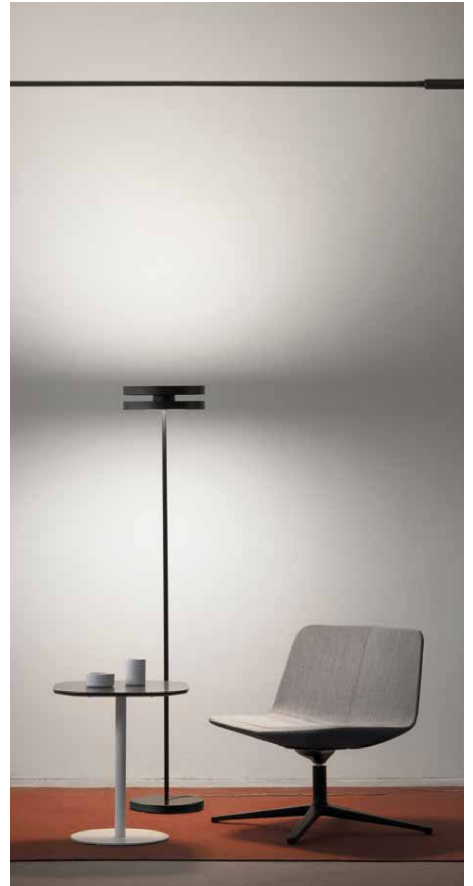
IT Nella pagina successiva: Led Machine F3 , versione da terra con finitura nero opaco. EN On the next page: Led Machine F3 , floor version with matt black finish.