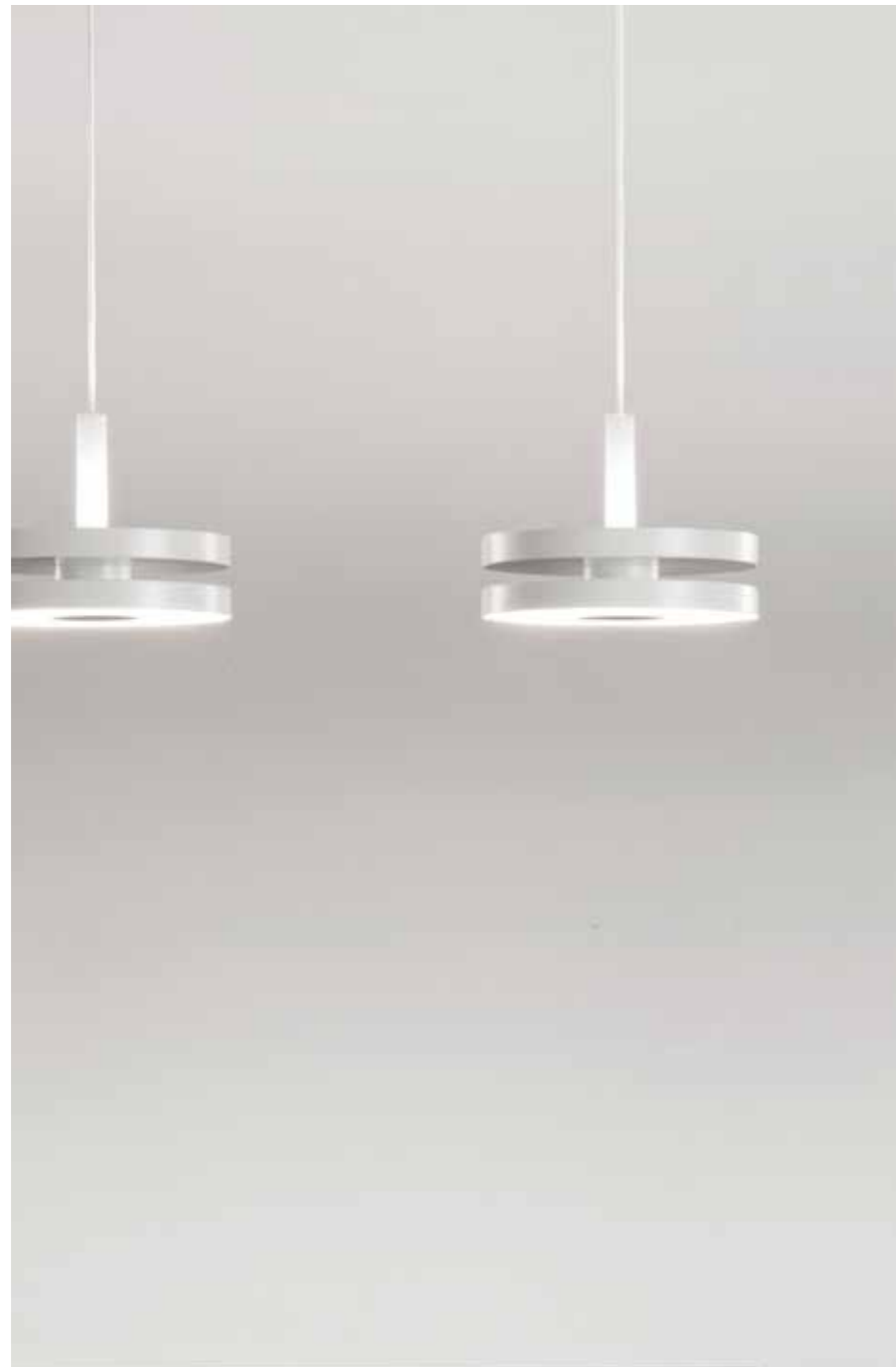
IT In questa pagina: Led Machine S3 , versione a sospensione con finitura bianco opaco. EN On this page: Led Machine S3 , suspension version with matt white finish.