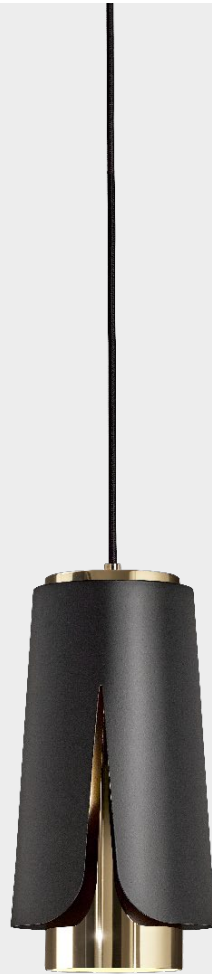
Tulipa Matt black Luxury gold