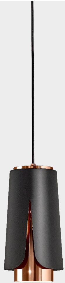
Tulipa Matt black Polished copper