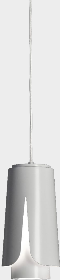
Tulipa Matt white Matt white

The eight colour combinations have been designed to offer interesting unions and contrasts between opaque and glossy finishes, but the materials allow you to write numerous other unpublished chapters as well with custom colors on request.