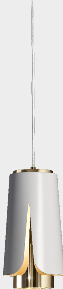
Tulipa Matt white Luxury gold