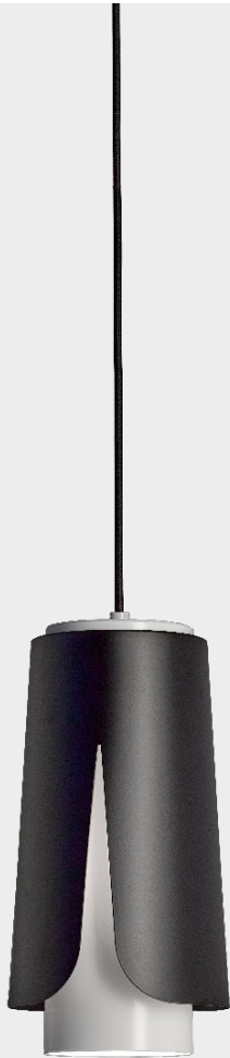
Tulipa Matt black Matt white