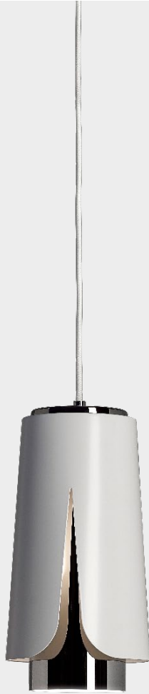
Tulipa Matt white Black chrome