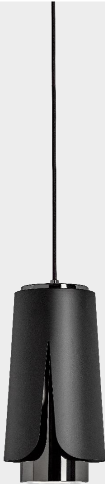
Tulipa Matt black Black chrome