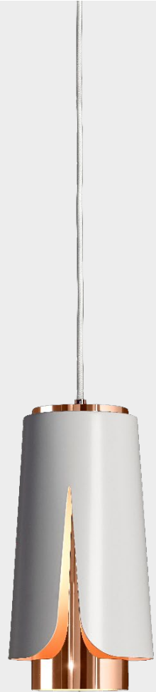
Tulipa Matt white Polished copper